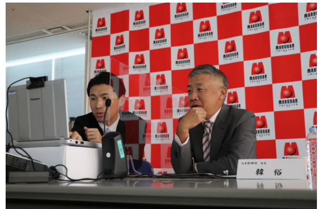
▲時間内では答えきれない程の質問が!