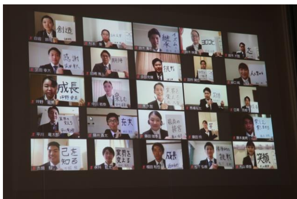
▲決意表明を書いた色紙を掲げる内定者たち