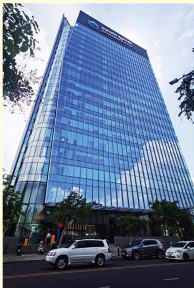
2021年1月 新本社ビル「サタパナタワー」にて営業開始