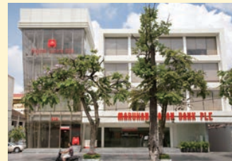
マルハンジャパン銀行本店 (現・サタパナ銀行本店)

アセアン地域への優れた銀行サービス提供を 目指し、カンボジア(プノンペン)に同国初の 日系商業銀行マルハンジャパン銀行(現・サタ パナ銀行)をオープン。次いで2013年にはラ オス(ヴィエンチャン)にマルハンジャパン銀行 ラオスを開業。