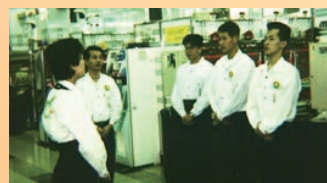
マルハン草薙アピア店

業界に接客の概念すら存在していない時代、現社長の韓裕を中心に「パチンコはサービス業である」という思いのもと、「業界を変える」という挑戦がスタート。業界の常識を打ち破るサービスマナーモデル店 マルハン草薙アピア店をオープンし、業界に大きな変革を起こす。