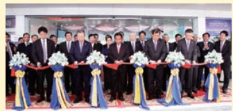
サタパナ銀行開業式典

マルハンジャパン銀行が子会社である大手マ イクロファイナンス機関 サタパナ社と統合し、 新生サタパナ銀行が営業開始。カンボジア全 土に163の拠点を持つカンボジア第2位の商 業銀行なる。