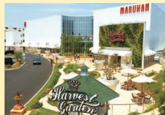
マルハン千葉北店

エンターテイメントとしてのパチンコの新しい 価値を創造するべく、パチンコをする人もしな い人もともに楽しめる場としてデリ&ビュッフェ を融合させた複合施設 Harvest Garden およびマルハン千葉北店をオープン。