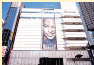
マルハンパチンコタワー渋谷

平成7年7月7日、「接客サービス=おもてなし」を重視したマルハンパチンコタワー渋谷がオープン。日本経済新聞社「1995年優秀先端事業所賞」を受賞するなど各界から高評価を受けた。