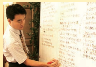
イズムプロジェクト

急成長によって拡大する組織の心をつなぐため、マルハンが目指す姿を確認し合うプロジェクトを立ち上げた。全従業員が延べ550日もの間、膝を突き合わせて議論を重ね、その思いが「マルハンイズム」として制定された。