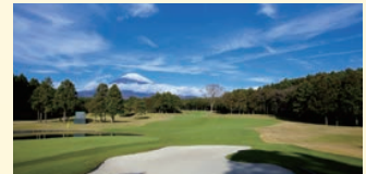
太平洋クラブ 御殿場コース

太平洋クラブ 御殿場コースをはじめとする17 の名門コースを保有するゴルフ場「太平洋ク ラブ」の経営権を取得。サービス業としてのノ ウハウや人材の投入により、新たな価値創造 を目指す。