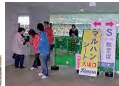
マルハンシートは、ゴール裏のトリニータサポーター席に近く、興奮と熱気が感じられます