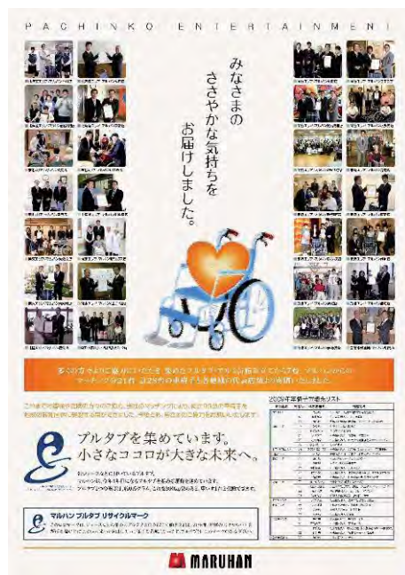
2009プルタブ収集活動報告ポスター

大分トリニータ 九石ドームマルハンシート観戦チケットを地域の方々へJ2リーグ大分トリニータホームスタジアムである九州石油ドームの試合観戦チケットを、1試合につき1,266席分、2007年より6年間に渡って購入し、地域の子どもたちや障害者・高齢者の方々へ提供しています。このような活動を通して、スポーツの振興、地域の活性化、青少年育成、障害者・高齢者への福祉など、地域社会に貢献したいと考えています。