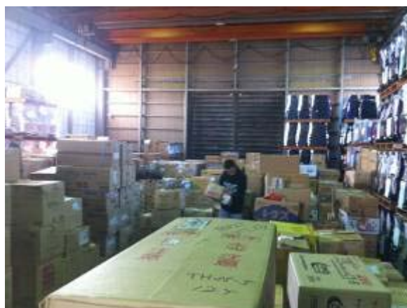
物資が倉庫に集まった時の様子