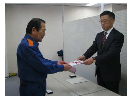
いわき市への寄贈の様様