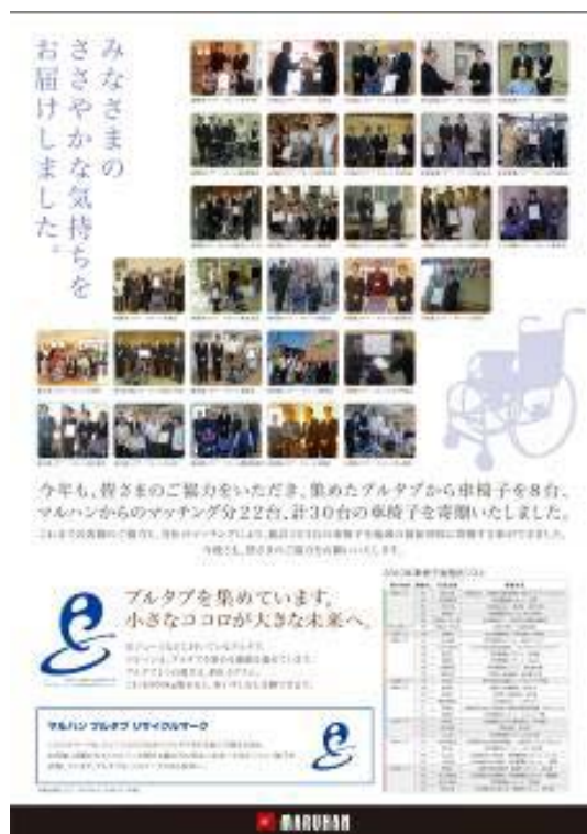
2010プルタブ収集活動報告ポスター

今年のプルタブ(アルミ缶)収集活動により、車椅子8台分の寄付が可能な約6,400Kgを達成したことに伴い、会社より22台の車椅子をマッチング購入し、合わせて30台の車椅子を寄贈しました。今までの活動を通じ、寄付した車椅子は123台になりました。