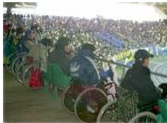
マルハンシートは、ゴール裏のトリニータサポーター席に近く、興奮と熱気が感じられます