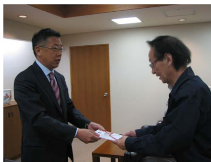
仙台市への寄贈の様様