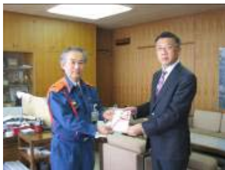
名取市への寄贈の様様