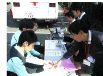
店舗駐車場で献血に参加する従業員

また、多くのお客様からも献血参加のご協力をいただいております。従業員の自らの提案で開始された本活動を、今後も社会貢献活動の一環として、当社の風土・文化として広めていきたいと考えています。