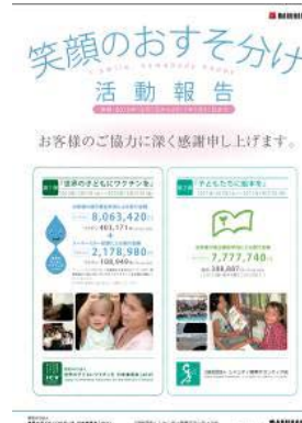
2010活動報告ポスター