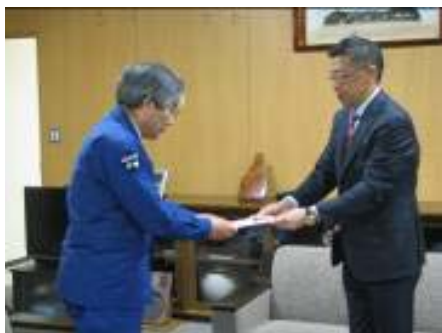
石巻市への寄贈の様様

・4月13日、石巻市・仙台市・名取市・いわき市へ各1億円を市民の皆様への義捐金として寄付させていただきました。